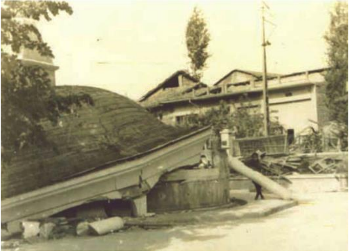
Ahmet Çelebi Camii Şadırvanının depremden sonraki durumu

Yaklaşık olarak 3000 km 2 genişliğindeki sarsıntı alanında takriben 3500 ev tamamen yıkılmış, 7000 ev ağır surette ve 10.600'den fazla bina da fazla ölçüde hasara uğramıştır. 33.000 aile, yaklaşık olarak 80.000 kişi barınaksız kalmış, 6 saniye süren depremde 800 kişi ölmüş ve 520 kişi yaralanmıştır.